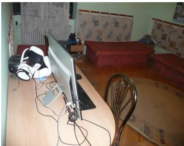
Počítač a boxerské rukavice (Sedmokrásky)

Pri prieskume sme videli, že deti majú k dispozícii rôzne športové vybavenie (stolný futbal, športové náradie, bicykle), rôzne spoločenské hry. Viaceré deti sa vracali z krúžkov. Tiež sme pozorovali deti z oboch samostatných skupín, že odchádzali von sa prejsť, a to v rôznom čase. Mnohé deti sa s niečím zabávali, hrali sa hry, niektoré si čítali, behali po dome, hrali sa so psom. Niektoré deti robili menšie domáce práce, iné sa hrali s mobilom, tabletom, pozerali televízor. Uvedené sme pozorovali v oboch samostatných skupinách.