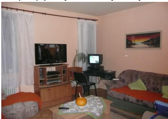
Obývacía izba (Sedmokrásky)

„Tety sú fajn, v pohode. Sú prísne podľa toho, ako sa my správame.“ (Sedmokrásky)