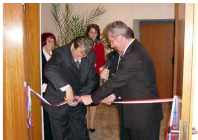
Slávnostné otvorenie regionálneho pracoviska Kancelárie verejného ochrancu práv v Žarnovici v decembri 2005.

Moderný demokratický a právny štát predpokladá nielen dodržiavanie základných práv a slobôd orgánmi štátu, ale aj uvedenie a ich domáhanie sa širokou verejnosťou. Čo najširšia informovanosť a výchova k ľudským právam musí byť implementovaná do každodenného života človeka, a to bez ohľadu na jeho vek, sociálne postavenie či iné kritérium. Potrebu priblíženia problematiky dodržiavania a ochrany základných práv a slobôd občanom v obciach, mestách a regiónoch si plne od počiatku svojho pôsobenia uvedomuje aj verejný ochranca práv. Preto už od začiatku svojej činnosti orientuje aj svoje aktivity do jednotlivých regiónov Slovenska.