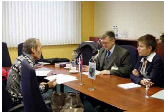
Deň otvorených dverí v regionálnom pracovisku Kancelárie verejného ochrancu práv v Žiline v decembri 2007.

Medzinárodného dňa ľudských práv, keď verejný ochranca práv a právnici jeho kancelárie zrealizovali „Deň otvorených dverí“ pre všetkých záujemcov o problematiku ochrany práv a slobôd práve v danom regióne.