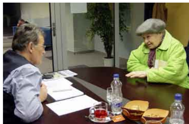
Verejný ochranca práv pri prijímaní občianky v Žiline v decembri 2007.

ností príslušnému i generálnemu prokurátorovi, • po apelácii verejného ochrancu práv obec vybudovala inžinierske siete k rodinnému domu dôchodcu žijúceho s 93-ročnou mamou, • po žiadosti verejného ochrancu práv obecné zastupiteľstvo zmenilo svoje rozhodnutie neschváliť odpustenie penále za nezaplatenie dane z nehnuteľnosti dôchodcovi v zlej sociálnej situácii, • na základe upozornenia verejného ochrancu práv starostka obce začala riešiť problém, ktorý vznikol ešte v roku 1987 tým, že obec na pozemku podávateľa vybudovala cestu z dôvodu regulácie miestneho potoka, obecné zastupiteľstvo občanovi odsúhlasilo finančnú náhradu za nevysporiadanú výmeru, • prispel v spolupráci s územnou samosprávou k prideleniu bytov rodinám s maloletými deťmi v ťažkej ekonomickej a sociálnej situácii, • upozornil Národnú radu Slovenskej republiky na právo občanov zúčastňovať sa na správe verejných vecí pri voľbe primátora, na problém regulovaného nájomného, na problémy týkajúce sa platenia poplatkov za komunálne odpady a drobné stavebné odpady i potrebu riešenia problému neplatičov nájomného.